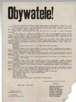
Labelki Komitetu Obrony Śląska Górnego prosząc o wsparcie Polaków dla Górnego Śląska wzywał po wybuchu III powstania śląskiego w maju 1921 roku do natychmiastowej, kolejnej zbiórki przeznaczanej dla Górnego Śląska. Oprócz pieniędzy oczekiwano na żywność i ubrania dla walczących powstańców śląskich (AP w Lublinie, Starostwo Powiatowe Konstantynowski).