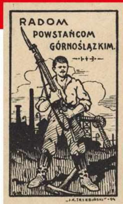
Podczas zbiórek pieniężnych na pomoc dla Górnego Śląska nie ukrywano w Polsce, że chodzi o uzbrojenie śląskich powstańców, a nie tylko o działania propagandowe podczas plebiscytu. Przedstawiony na plakacie z Radomia Górnoślązak odrzuca kilof, by chwycić za broń i do tego skierowanego karabinu odnosi się wezwanie: „Radom powstańcom górnośląskim” (AP w Radomiu, Zbiór Romana Ryty).