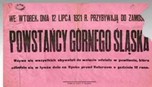
Obywateli rekrutowanych przez Wojsko Polskie do walki w III powstaniu śląskim w 1921 roku umieszczano po ich powrocie do domów. Tutaj zaproszenie na taką uroczystość w Zamościu, już po rozdzieleniu walczących stron przez aliantów w lipcu 1921 roku (AP w Zamościu, Zbiór alizów, ogłoszeń, druków ulotnych).