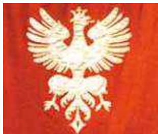
Orzeł ze sztandaru powstańczego

Zanim przystąpisz do rozwiązywania zadań przeczytaj zasady rozwiązywania testu: