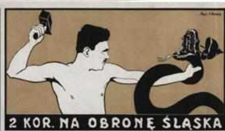
Wspieranie materialne miało nie tylko służyć doradniej pomocy, ale było także narzędziem politycznej walki. Tutaj każdy datkę przedstawiony jako wspomnienie walki górnośląskiego robotnika „z pruską żmiją”.

Dziś dzień Górnego Śląska — Podzielcie się chlebem z powstańcem górnośląskim!