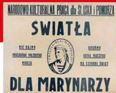
W całym Wojsku Polskim prowadzono akcję informacyjną o sytuacji na Górnym Śląsku. W Marynarce Wojennej starano się łączyć idee walki o polską Pomorze i Śląsk, jako działnice zagrożone pruskim rewanżyzmem (AP w Lublinie, Zbiór alizów i druków ulotnych).