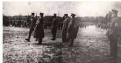
Z uciekinierów z Górnego Śląska w 1919 roku sformowano w Wojsku Polskim Pierwszy Pułk Strzelców Bytomskich. Nie mógł wziąć udziału w walkach podczas I powstania śląskiego w 1919 roku, odznaczony później w walkach z Rosją Kadziecką, m.in. w bitwach warszawskiej i nad Niemnem. Żołnierze Pułku jako ochotnicy brali potem udział w III powstaniu śląskim. Tutaj początek dziejów Pułku, uroczyście przysięga jednego z batalionów 20 kwietnia 1919 roku (AP w Katowicach, Śląski Instytut Naukowy im. J. Korczewskiego w Katowicach).