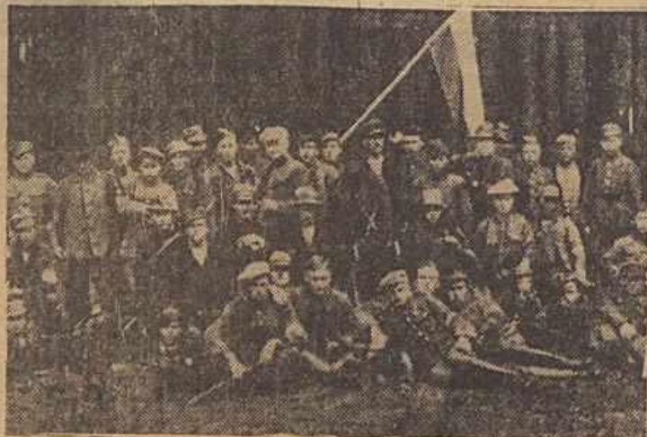
Jeden z oddziałów powstańczych walczących w nadodrzańskich lasach.