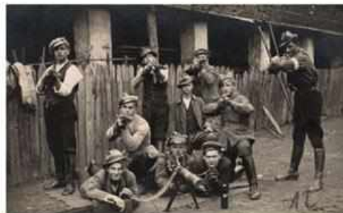
Najgroźniejszą, a zarazem najbardziej skuteczną bronią w czasie walk powstańczych były lekkie i ciężkie karabiny maszynowe. Używano jednak również lekkich broni myśliwskiej, którą trzymano w domach, albo rekwizowano niemieckiej służbie lotnej.