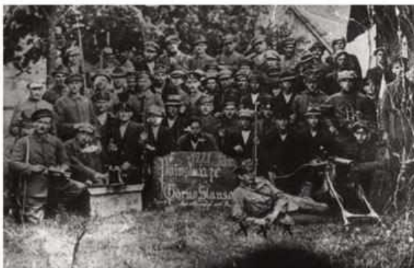
Oddział górnośląskich powstańców w maju 1921 roku. Po prawej ciężki, po lewej lekki karabin maszynowy. Bardzo skuteczną bronią powstańców były także widoczne na zdjęciu trzonkowe granaty ręczne, wykonywane z ciężkimi samodzielnymi, z wykorzystaniem materiałów wybuchowego poeksploatowanego w górnośląskich kopalniach.