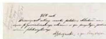
Nawet najmniejsze gminy (tzw. gminy w ramach możliwości) środki na pomoc materialną dla Górnego Śląska. Tutaj zawiadanie potwierdzające taką zbiórkę w nadgranicznej gminie Przystajki, w dzisiejszym powiecie kłobuckim. Zbiórka przyniosła 908 marek polskie w gminie liczącej około 4 tys. mieszkańców (AP w Częstochowie, Komitet Plebiscytowy na Okręg Częstochowski).