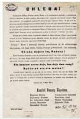
W czasie powstań śląskich apeli o pomoc materialną były szczególnie ważne. Tutaj wezwanie do zbiórki chleba w Zamościu w czasie III powstania śląskiego w 1921 roku (AP w Zamościu, Zbiór afiszów, ogłoszeń, druków ulotnych).