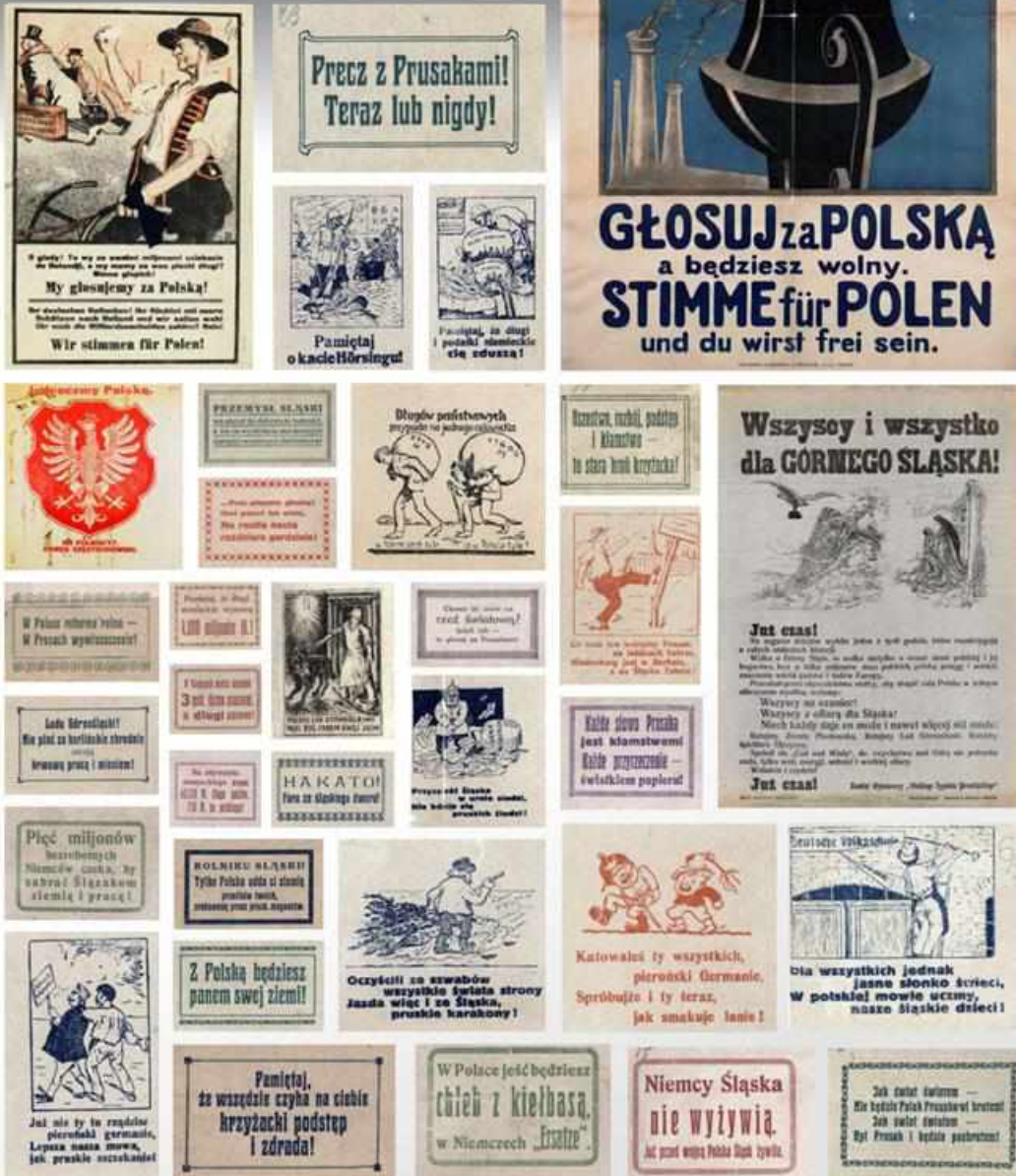
Z archiwów: AP w Częstochowie, Komitet Plebiscytowy na Okręg Częstochowski; AP w Katowicach, Polski Komitet Plebiscytowy dla Górnego Śląska w Bytomiu; AP w Płocku Oddział w Karcie; Akta miasta Katowic; AP w Radomiu. Zbiór afiszy, plakatów i druków ulotkowych.

W latach 1919-1921 wydano w Polsce niezliczoną ilość plakatów i materiałów propagandowych. Miały one mobilizować nie tylko Górnoślązaków w trakcie kampanii plebiscytowej. Były także niezbędne do utrzymywania przez prawie trzy lata gotowości polskiego społeczeństwa do pomocy Górnemu Śląskowi. W ten najprostszy sposób starano się dotrzeć do wszystkich Polaków, niezależnie od ich przekonań politycznych, wyznania, pozycji społecznej. Stąd znajdziemy wśród nich i odwoływanie się do patriotyzmu i szczerstwo i wzbudzanie współczucia.