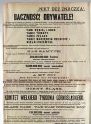
Również ziemniaki mogły być bronią polityczną. Tutaj doniesienia polskiej prasy („Głos Prowantu” z 20 listopada 1920 roku) o niemieckich zarządkach, iż organizowany na polecenie niemieckiej centrali związkowej, Zjednoczenia Zawodowego Polakiego, przywóz kartofli w ośrodek czołej jest „polską propagandą” (AP w Płocku Oddział w Kutnie, Akta miasta Kutna).