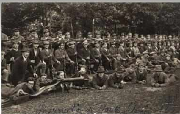
Na zdjęciu zrobionym przez francuskiego oficera sil rozjemczych łatwo dostrzec typowe uzbrojenie śląskich powstańców w czasie walk w 1921 roku. Dominowała ręczna broń strzelczą. Oprócz niemieckich maszynów często używano również karabinów austriackich i rosyjskich. Większość z nich pochodziła z magazynów Wojska Polskiego, ale w 1919 roku powstańcom udało się również zdobyć wiele karabinów z rąk opuszczającej teren plebiscytowy armii niemieckiej (AP w Katowicach, Śląski Instytut Naukowy im. J. Korczewskiego w Katowicach).

Pierwsze powstanie śląskie w 1919 roku upadło głównie ze względu na brak broni i amunicji. Nie wystarczało wykradanie jej z magazynów armii niemieckiej. Od 1920 roku za pośrednictwem Wojska Polskiego na teren plebiscytowy docierały transporty z bronią. Ich apogeum przypadło na okres III powstania śląskiego. Z danych zbiorczych z tzw. Centralnego Magazynu Uzbrojenia kontrolowanego przez referat uzbrojenia Naczelnej Komendy Wojsk Powstańczych wynika, że od jesieni 1920 roku do końca maja 1921 roku przez ten centralny magazyn przeszło dla powstańców prawie 50 tys. karabinów różnej produkcji. Według najlepiej poinformowanego w tej sprawie gen. Stanisława Szepetyckiego w trakcie intensywnych walk podczas III powstania śląskiego od 3 do 31 maja z Sosnowca na Górną Śląsk dotarło 59 transportów kolejowych, w których znalazły się obok karabinów, amunicji, mundurów i żywności, także działa, granatniki i moździerze. Bez tego wsparcia ze strony Wojska Polskiego oddziały powstańcze nie byłyby w stanie powstrzymać kontrofensywy niemieckiej na Górę św. Anny.