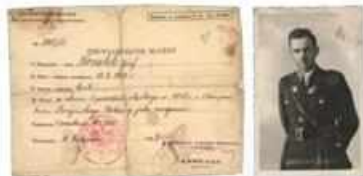
Po zakończeniu powstań śląskich, już w niepodległej Polsce, powstały związki kombatanckie, z których największą rolę odgrywał Związek Powstańców Śląskich. Większość materiałów archiwalnych w tym celu dokumentacja oddziałów, znalazła się w Archiwum Wojskowym. Prawdopodobnie one później okres służby. Tutaj zaświadczenie wydane dla uczestnika walk z powstaniu pszczyńskiego podczas I powstania śląskiego (AP w Katowicach, Śląski Instytut Naukowy im. J. Korczewskiego w Katowicach).