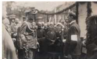
29 czerwca 1922 roku w Pszczyńcu wkraczającego na czele oddziałów polskich gen. Stanisław Szepetycki witał organizator miejscowej konspiracji wojskowej, por. Stanisław Kryżowski. Wycieczki odwiedzającym w 1921 roku za Dowództwo Obrony Plebiscytu generalowi w dowód wdzięczności symbolicznie ukłony karabin (AP w Katowicach, Śląski Instytut Naukowy im. J. Korczewskiego w Katowicach).