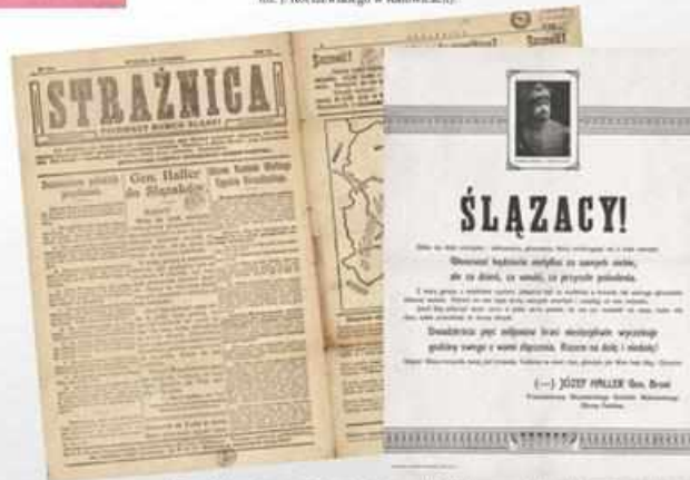
Nieraz było popularny na Górnym Śląsku gen. Józef Haller w przedmowa plebiscytu pisał się z osobistym apelem do Górnoszląskich. Odwołując się do ich patriotyzmu nakazywał im, by głosowali jak „kate Bóg i Ojczyzna”.