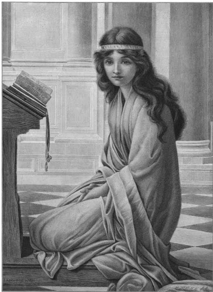
Ilustracja 7. Modlitwa. Drzeworyt na podstawie obrazu Henry'ego Rylanda