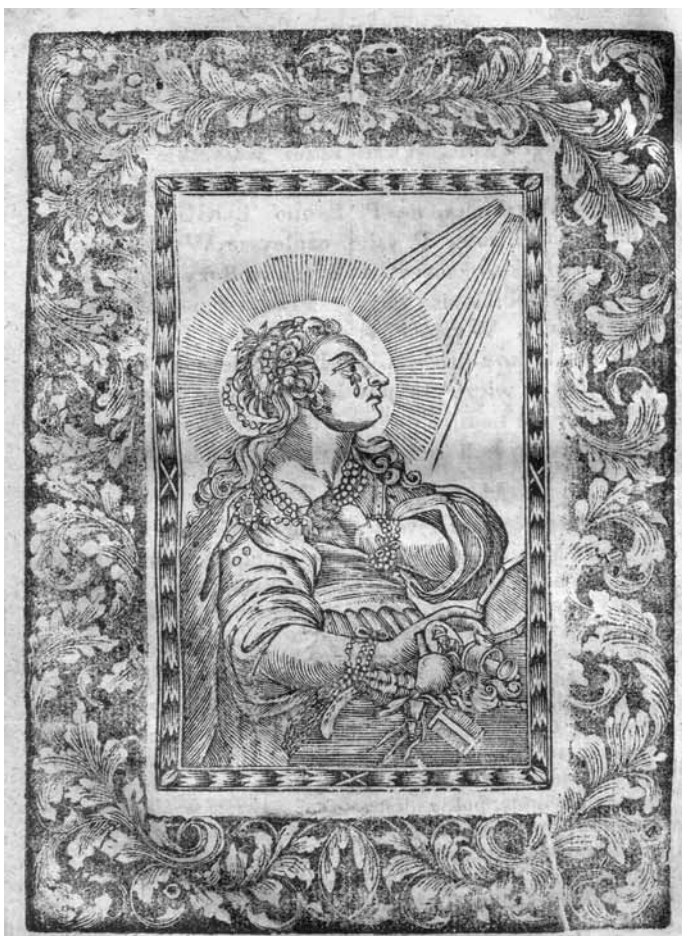
Ilustracja 4. Dama pokutująca. Drzeworyt z modlitewnika dla niewiast autorstwa Rudolfa Pollacza