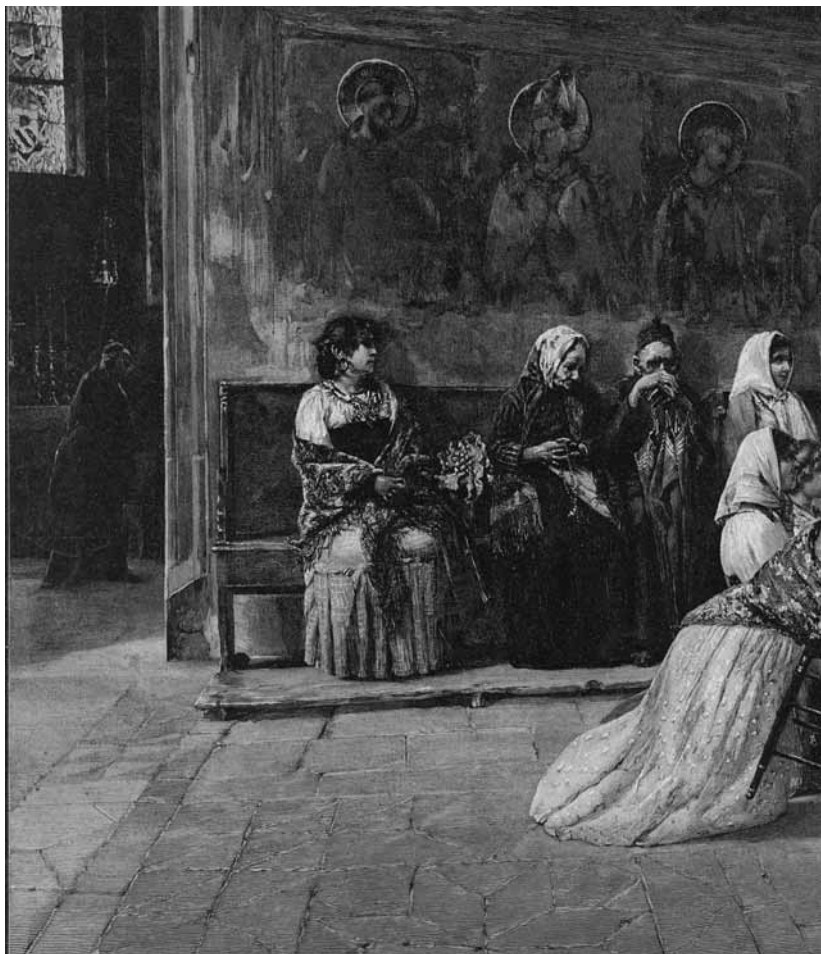
Ilustracja 3. Modlitwa w franciszkańskim kościele Santa Croce we Florencji