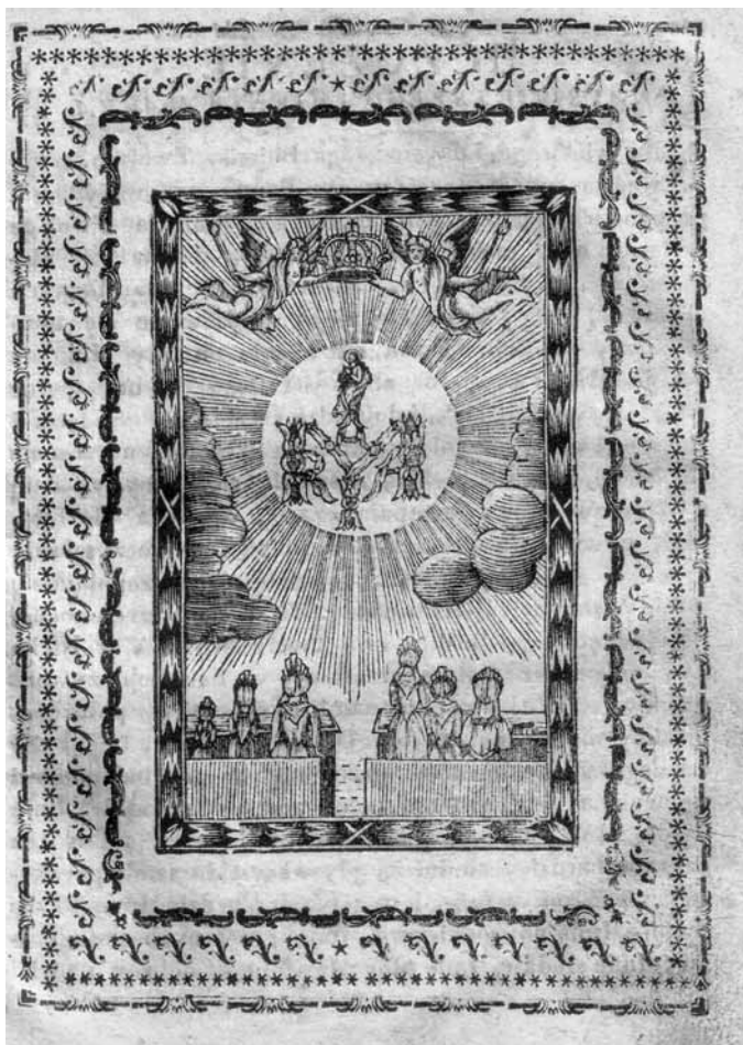
Ilustracja 5. Modlące się kobiety. Drzeworyt z modlitewnika dla niewiast autorstwa Rudolfa Pollacza